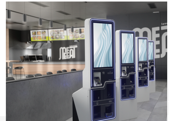
3. Faible volume de cash avec kiosque intégrés C27