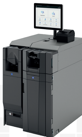
2. Volume faible de cash CI-10CX/CI-50B