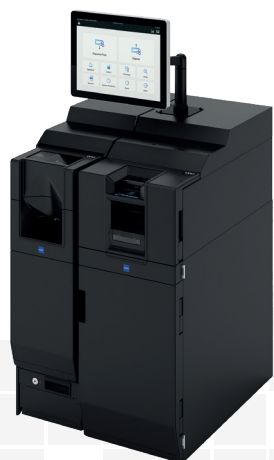
1. Volume faible de cash CI-10X

La gamme CASHINFINITY back-office s'adapte aux besoins des hôteliers, quels que soient les volumes d'espèces à traiter ou la surface disponible: