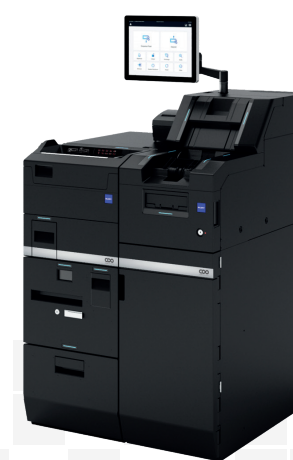
4. Volume élevé de cash CI-100X

« En particulier le lundi, cela nous permet d'économiser plusieurs heures, car il n'est plus nécessaire de compter et de vérifier les encaissements. »