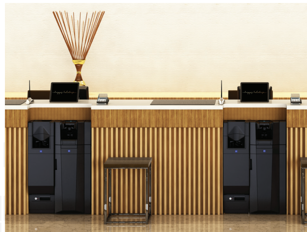
2. Volume élevé de cash CI-50B/CI-10CX