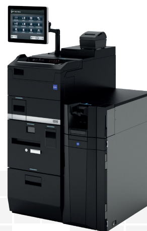
3. Volume moyen de cash CI-100CX/CI-50B